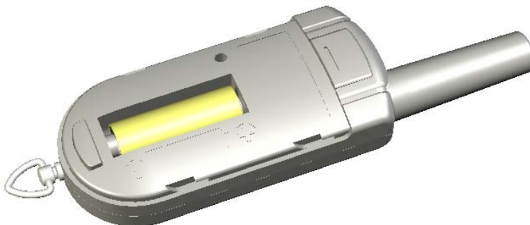
Рис.2. Установка батареи.

Для замены батареи утопите фиксатор в нижней части тыльной стороны корпуса, сдвиньте крышку батарейного отсека вниз и снимите ее. Извлеките старую батарею и установите новую, соблюдая полярность, указанную на корпусе. Нажмите тревожную кнопку, убедитесь, что светодиод вспыхивает зеленым, и установите на место крышку батарейного отсека.