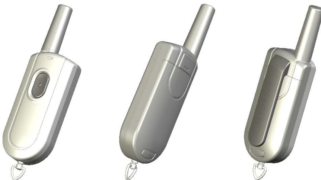
Рис. 1. Внешний вид радиокнопки.

На тыльной стороне под съемной крышкой находится батарейный отсек. Кроме того, с тыльной стороны корпуса может быть установлена съемная клипса для ношения в нагрудном кармане или на поясе.